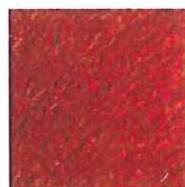
45 terra cotta