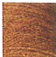
24 lt. brown